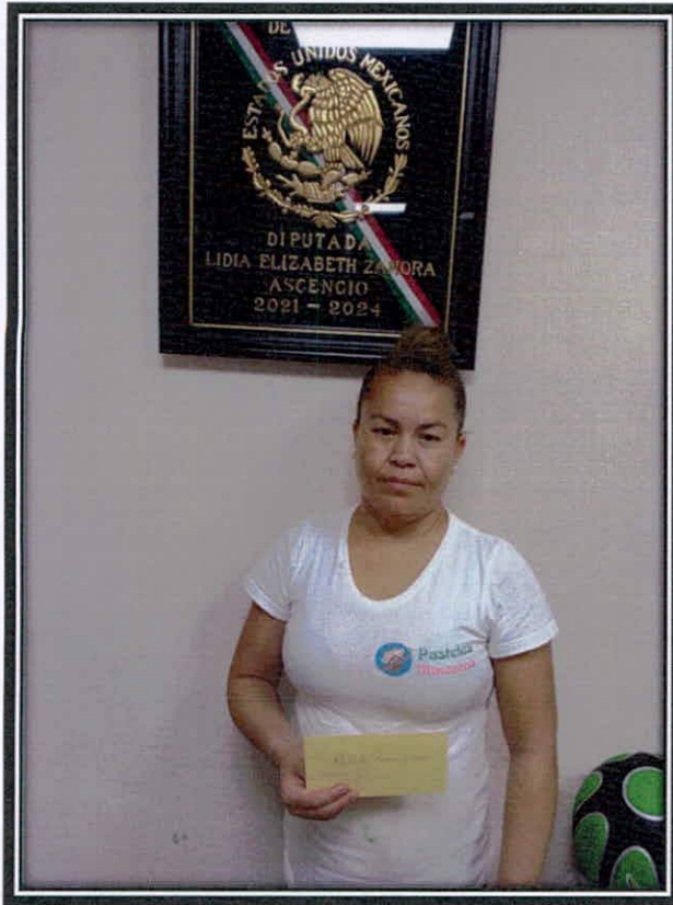
Apoyo economico para madre soltera.

Vicepresidenta de la Comisión de Trabajo y Previsión Social