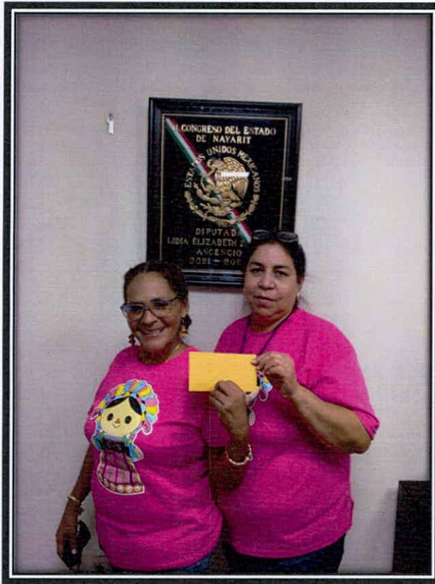
Apoyo económico para un jardín de niños.

Vicepresidenta de la Comisión de Trabajo y Previsión Social