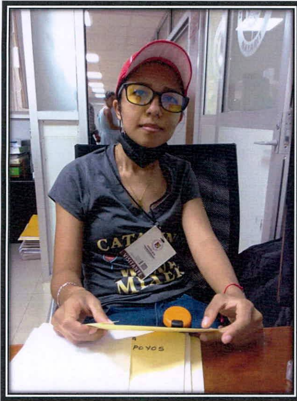
Apoyo economico a madre soltera

Vicepresidenta de la Comisión de Trabajo y Previsión Social