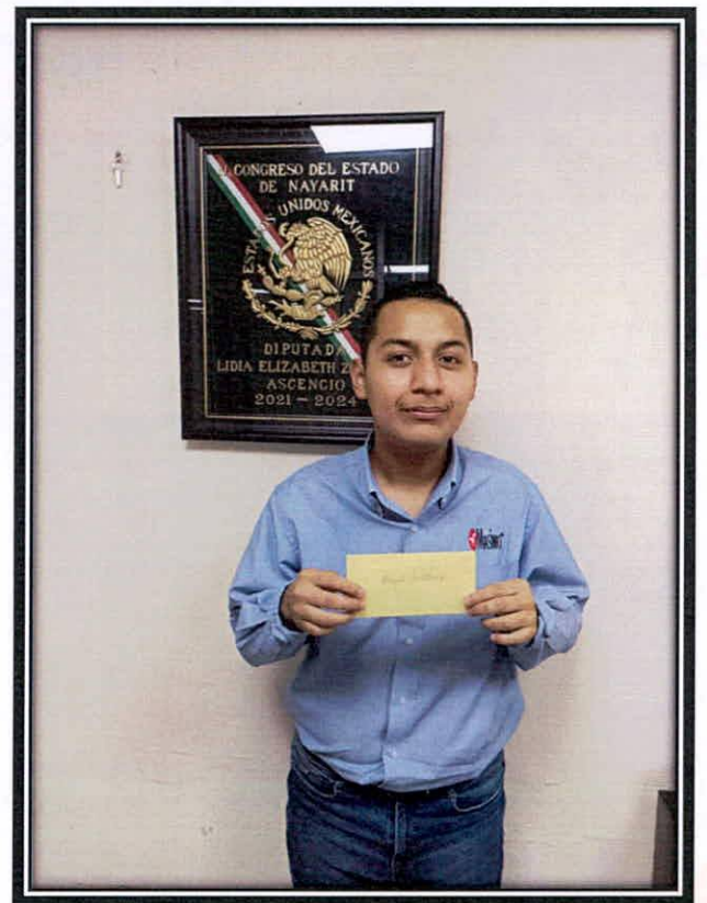
Apoyo económico para un joven para continuar con sus estudios