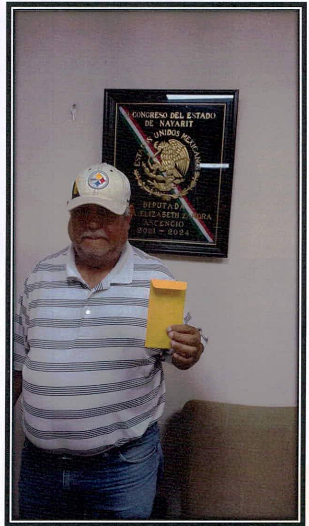
Apoyo economico a adulto mayor.