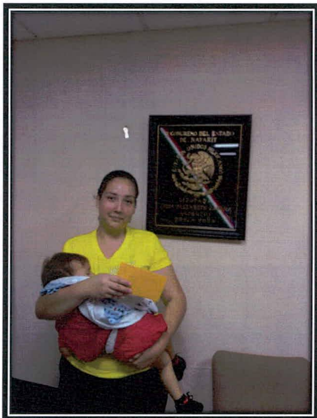
Apoyo economico a madre soltera.

Tel. 215 2500 Ext. 155 Email: dip.lidiazamora@congresonayarit.mx