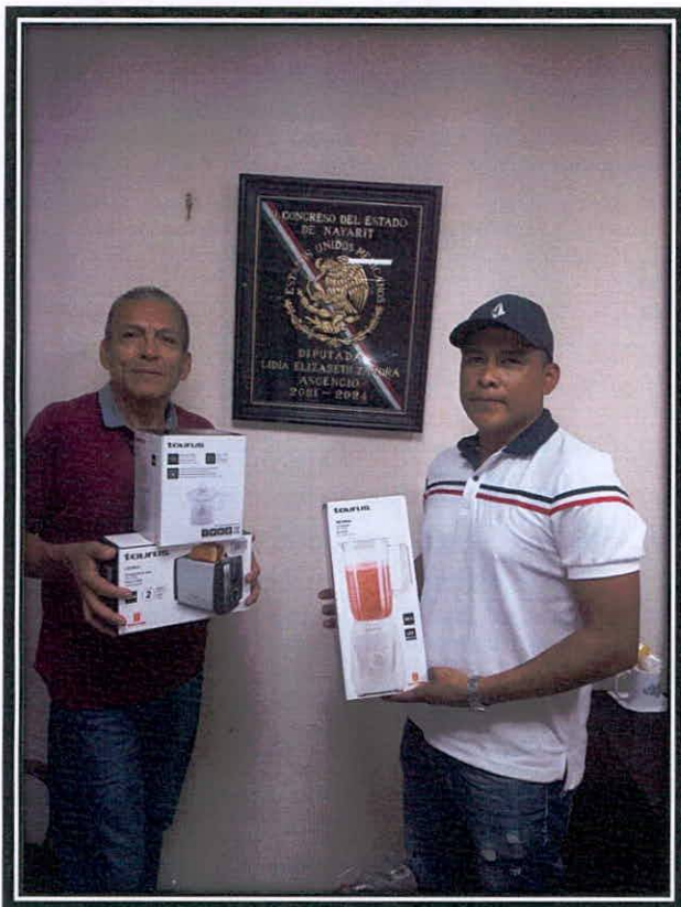
Apoyo a casa de vida cristiana "La armadura de dios, a.c."

Vicepresidenta de la Comisión de Trabajo y Previsión Social