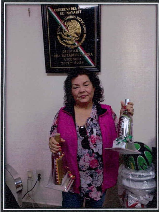
Entrega de regalos.

Vicepresidenta de la Comisión de Trabajo y Previsión Social