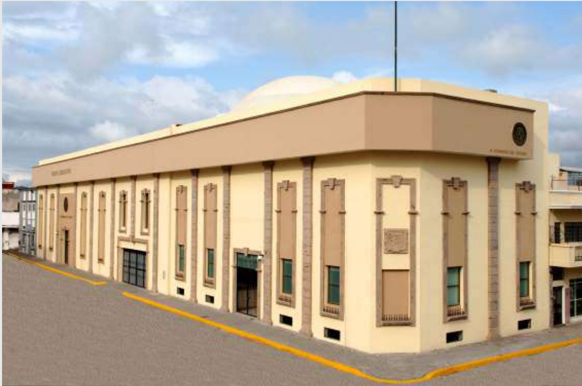
Poder Legislativo Nayarit