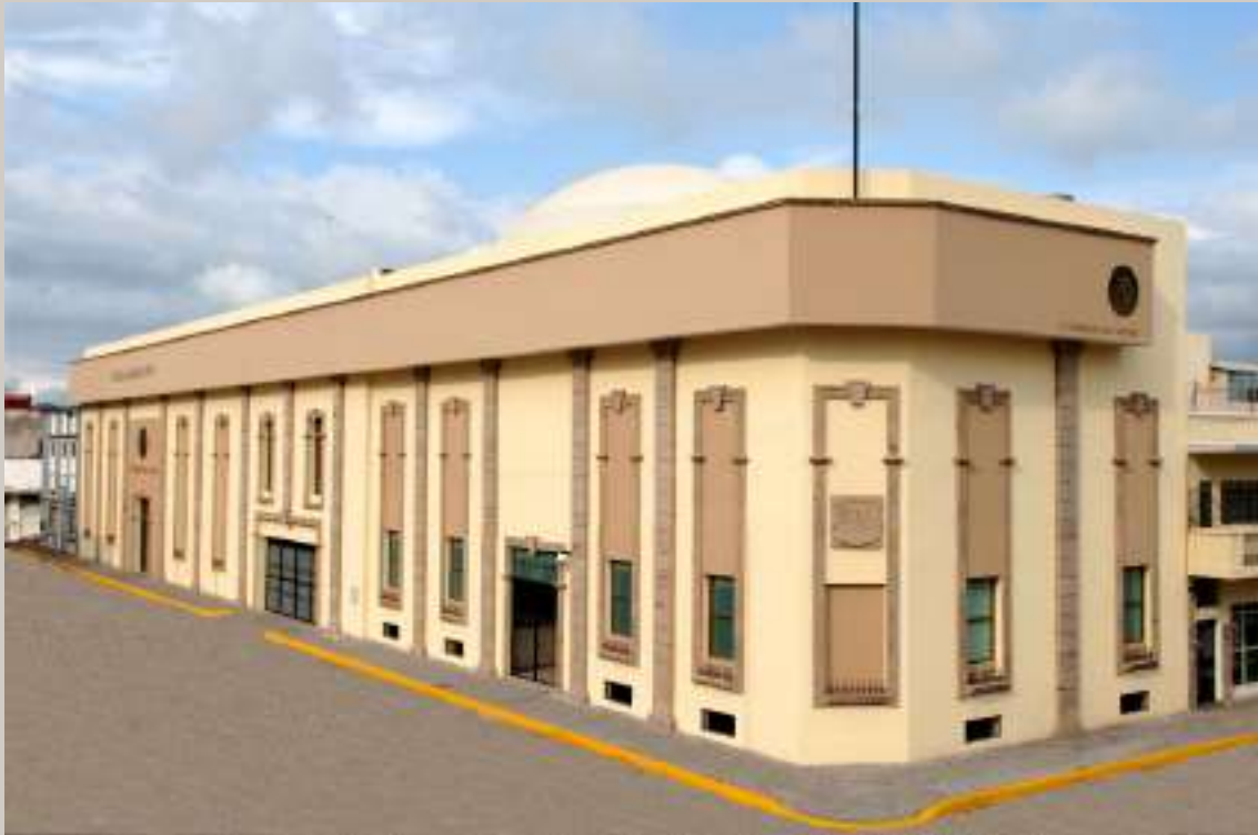
Poder Legislativo Nayarit